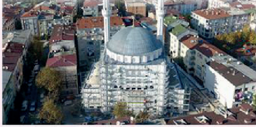
YUNUS EMRE CAMİİ

Dini ve manevi yaşamın merkezi olan ibadethanelere, Gaziosmanpaşa'da yenileri ekleniyor. Yapımı tamamlanmak üzere olan 4 cami, Ramazan ayında ibadete açılmaya hazırlanıyor.