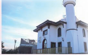
TEM AVRASYA CAMİİ