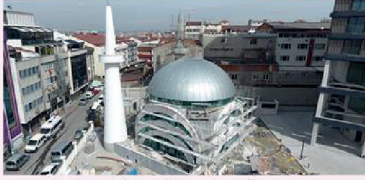
ÇİFTE MİNARE CAMİİ