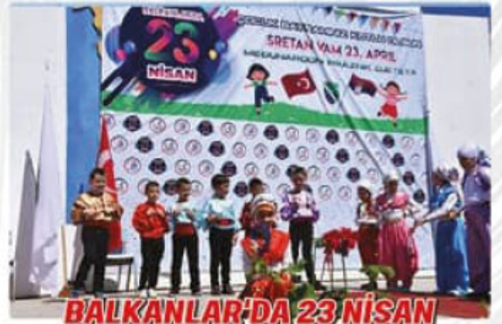
BALKANLAR'DA 23 NİSAN TUTİN-SANCAK BÖLGESİ

SOSYAL FARKINDALIK PROJELERİMİZ VE EĞİTİM KALİTEMİZLE DAİMA BİR ADIM ÖNDEYİZ... 2300'DEN FAZLA ÜYEMİZLE GELECEĞE EMİN ADIMLARLA YÜRÜYORUZ!