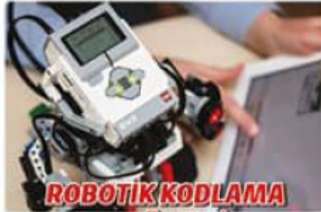
ROBOTİK KODLAMA ATÖLYESİ