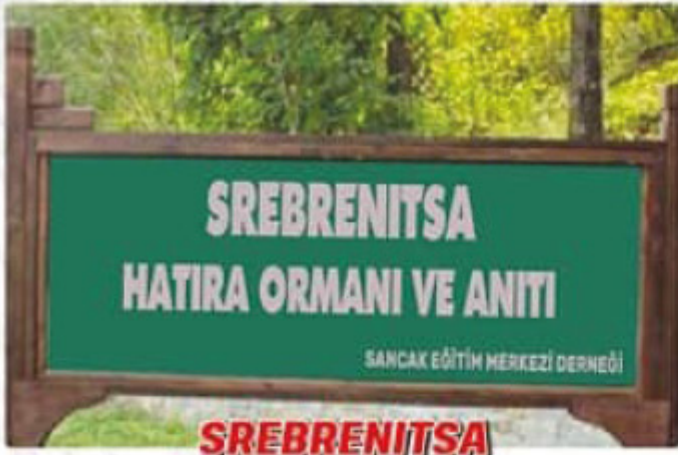
SREBRENITSA HATIRA ORMANI VE ANITI