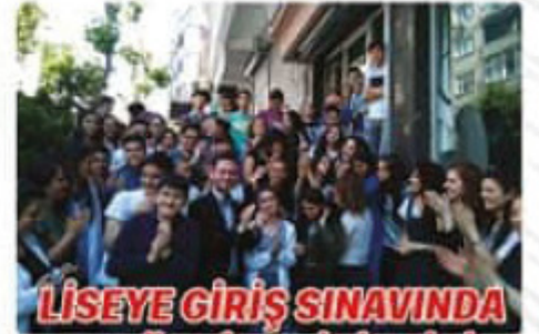
LİSEYE GİRİŞ SINAVINDA 2 TÜRKİYE BİRİNCİSİ