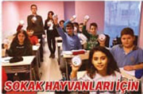
SOKAK HAYVANLARI İÇİN "BU KAPTA HAYAT VAR"