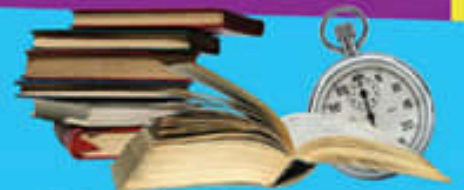
Hızlı Okuma ve Anlama